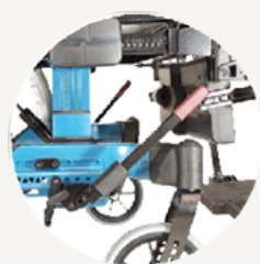
直観で操作できる赤いブレーキハンドル