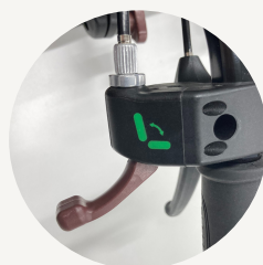
視認性の良い操作レバー