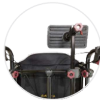
左右の位置調整が可能なヘッドサポート