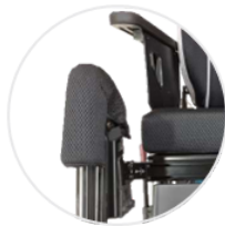
+50mmの調整が可能なレッグサポート