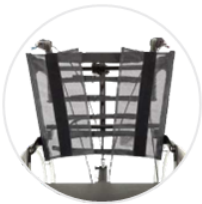
最適なフィット感を実現する背張り調整と、様々な上半身の形状に対応するバックサポートパイプ