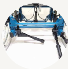
足で操作可能な転倒防止バー